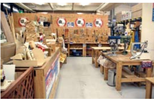
工作に必要な工具が揃っており、自分の工房のように自由に使うことができるお客様工房。