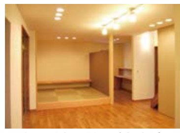
▲ひと目で見たできるように工夫された、ダイニング～和室～スタディコーナー。 ▲手間をかけずにさっと物を隠せるフルオープン収納棚。

います。勝手口側の土間の壁一面に、奥行きのある棚を作り、家族がそれぞれここに物を置くようにすれば特別な片付けは不要になります。しかも、玄関との仕切り戸を閉めれば表からは見えず、大変実用的な工夫も施されています。