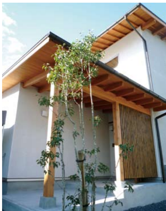
玄関ポーチに現れている梁(はり)や垂木(たるき)も滋賀県産材。大治工務店の「家づくりを通じて、地域全体の活性化や未来の環境に貢献できれば」との思いが垣間見える。

印象に残るのは、玄関土間。玄関正面の引き戸を開けると、奥の勝手口までひと続きになるこの広々空間。日本家屋の土間ならではの開放感と落ち着きが満ちていてほっとします。「共働きのなかで、片付けにそんなに手間をかけたくないうつ物がさっと隠せる工夫がほしい」とTさま。そこで、フルオープンの収納棚を設けて