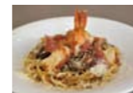
日替わりランチからえびとカキのカレークリームパスタ ¥1,500