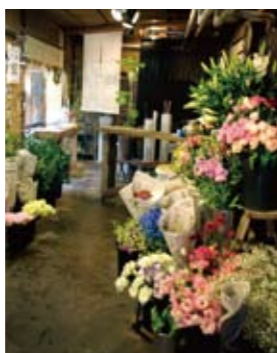
棟木に江戸寛永の年号が刻まれているという町家が「花屋かずろう王国」のお店。アンティークな雰囲気の内には色鮮やかな季節の花が並び、