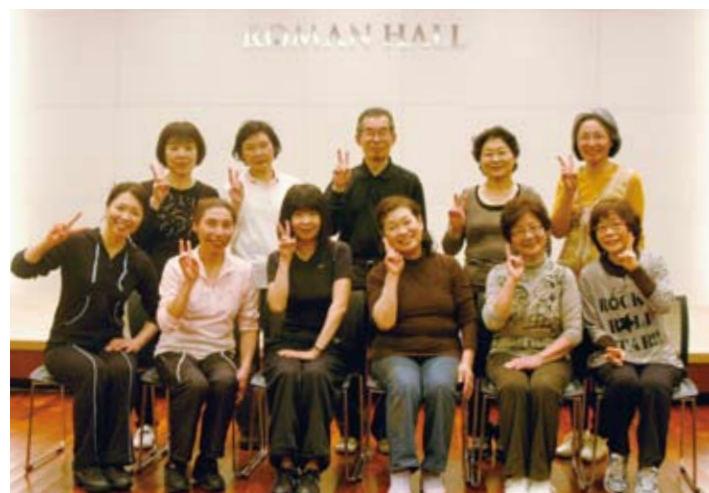
受講者の声「歌や踊りが苦手でも楽しく参加でき、1時間があっという間!続けやすい月謝も魅力!」