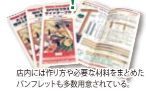
店内には作り方や必要な材料をまとめたパンフレットも多数用意されている。

アヤハディオ瀬田店 お客様工房 滋賀県大津市玉野浦1-1 ☎077-543-4777 ●平日/9:30~20:00 土日祝/9:00~20:00