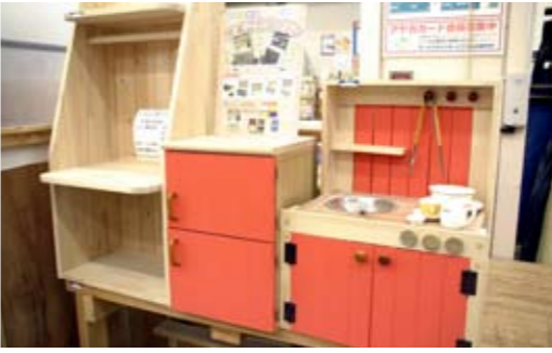
こんなかわいい子ども用のキッチンセットも作ることができる。