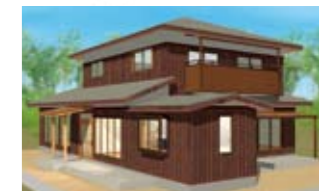
▲外観のイメージパースもこの通り