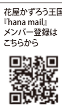
花屋かずろう王国「hana mail」メンバー登録はこちらから

有限会社 三瀧商店 / 花屋かずろう王国 滋賀県甲賀市水口町城内8-15 TEL.0748-62-8741 FAX.0748-62-8792 http://mitaki.jp/