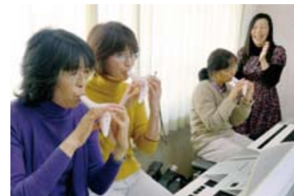
「オカリナはトライしやすい楽器ですが、息の入れ方で気持ちや反映しやすく、実は奥深いおもしろさがある楽器です」