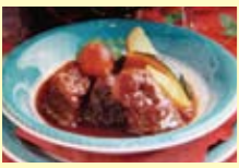
▲ビーフシチュー(1800円)。

大津 Grill として初めての寒い冬を迎えますが、店内は今まで同様ゆっくり・ほっこりのんびりお食事やお談話を楽しんで頂きたいと冬にふさわしい温かい飲み物や食べ物をご用意いたしております。また、冬の間はアクセサリー作りや子ども将棋教室、お茶の正しい入れ方などの文化サロンやイベントも計画していますので、お友達やご家族の方とお誘い合わせの上、気軽に足を運んでください!