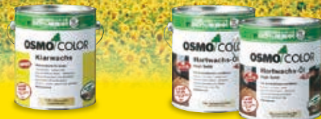
オスモカラー #1101 エキストラクリアー オスモカラーフロアークリアーラピッド #3232 つや有と#3262つや消し