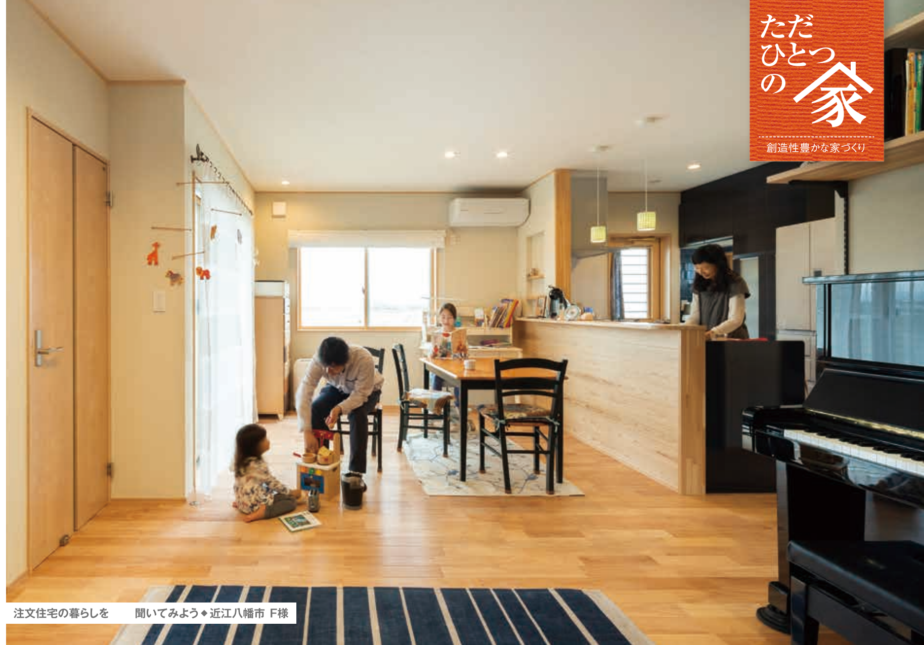
注文住宅の暮らしを 聞いてみよう◆近江八幡市 F様